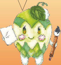
イメージキャラ ワッシャーくん