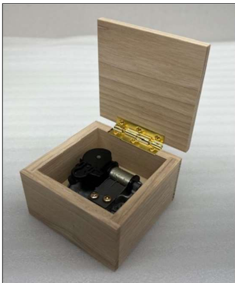
体験キットA完成イメージ