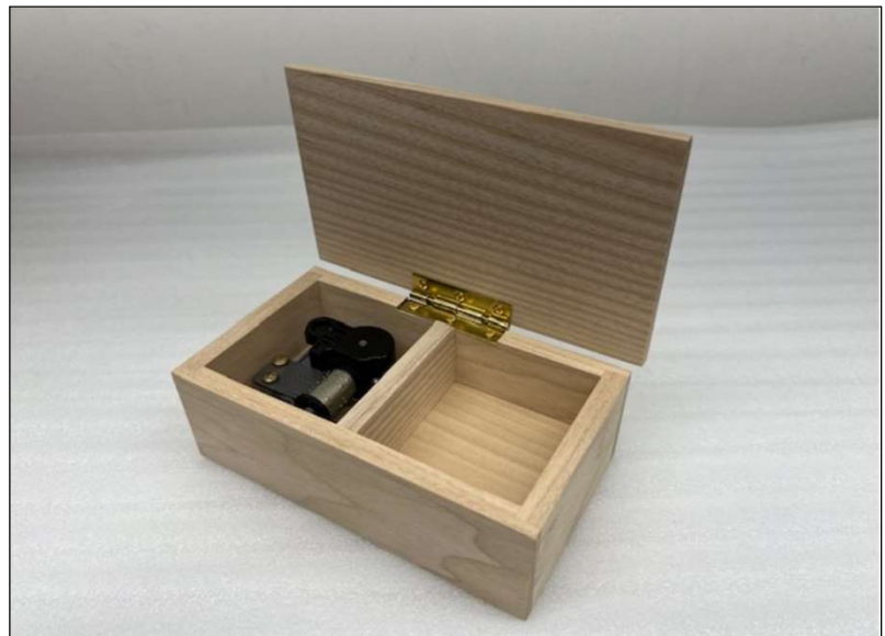
体験キットB完成イメージ