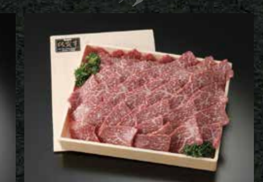
とろける美味しさ 佐賀牛 ももカルビ焼肉用 500g