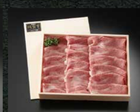
とろける美味しさ 佐賀牛 肩ローススライス 500g