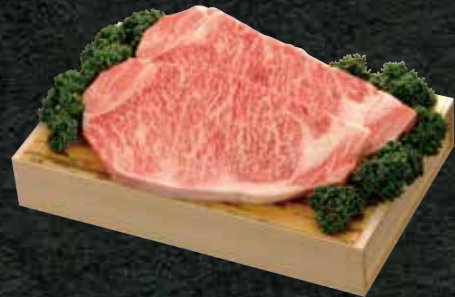
佐賀牛 ロースステーキ200g×2枚

部位：ロース(約200g×2枚) 事業者：佐賀県農業協同組合 ☎ 0952-52-6160