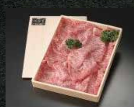
とろける美味しさ 佐賀牛ローススライス 500g