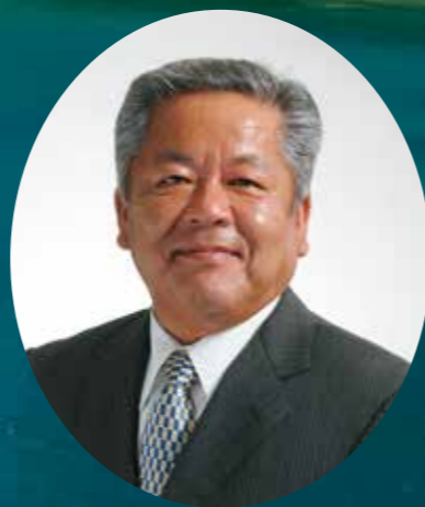
三島村長 大山 辰夫

一人でも多くの方に三島村を知って頂き、三島村を訪れ楽しんで頂ければと思ひながら情報発信をしております。ぜひ、自然と歴史を堪能しに三島村にお越し下さい。お待ちしております。